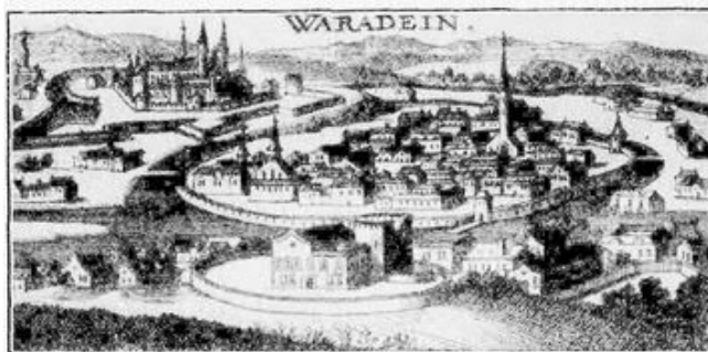
Nagyvárad a XVII. században