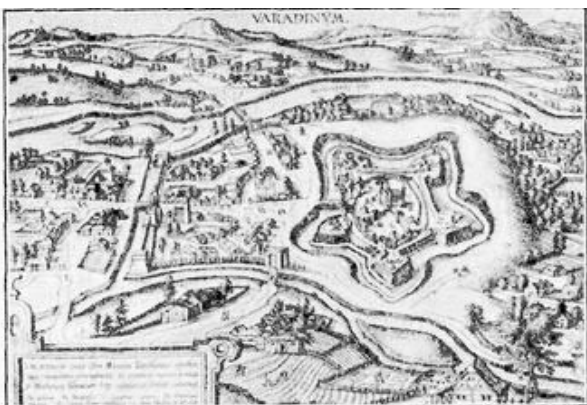
A város 1598-ban