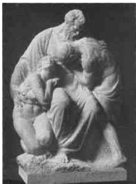
Pásztor János: Síremlékszobor a budapesti Kerepesi temetőben