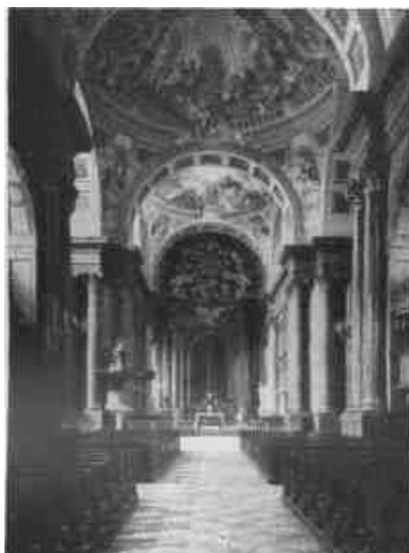
Héfele Menyhért: A székesegyház belseje