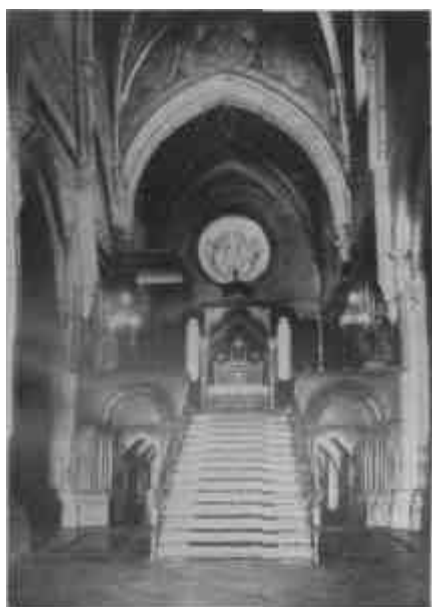
A pannonhalmi apátság templomának belseje