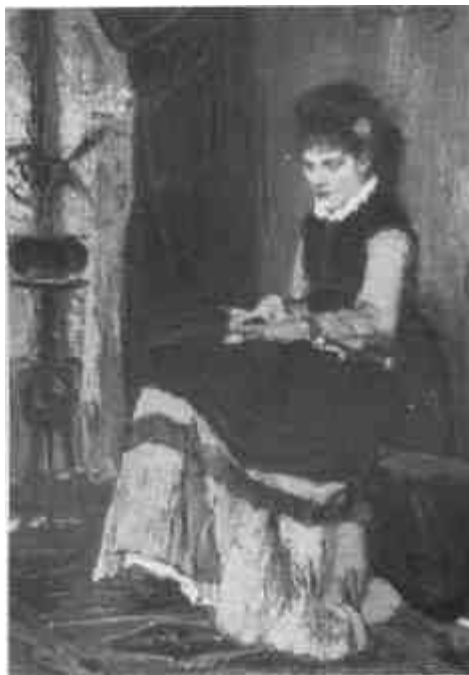
Munkácsy Mihály: Párizsi nő (Magántulajdon)