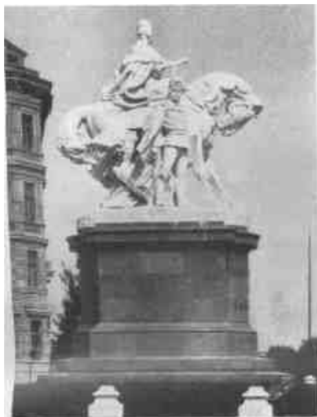
Fadrusz János: Mária Terézia pozsonyi emlékszobra (Lerombolták 1922-ben)