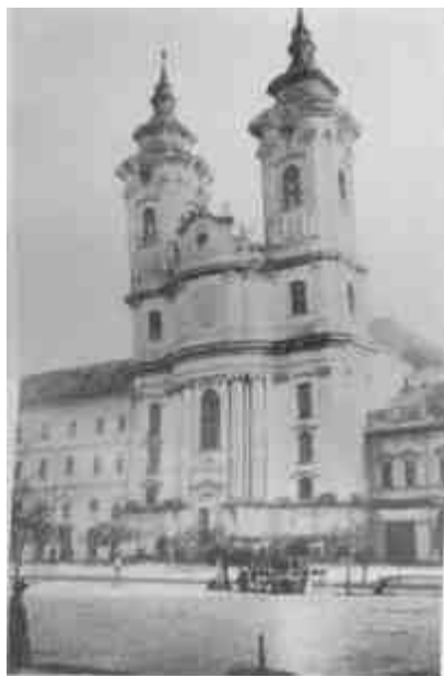
Az egri minorita-templom