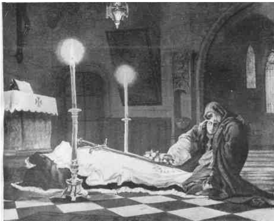
Madarász Viktor: Hunyadi László siratása (Szépművészeti Múzeum)