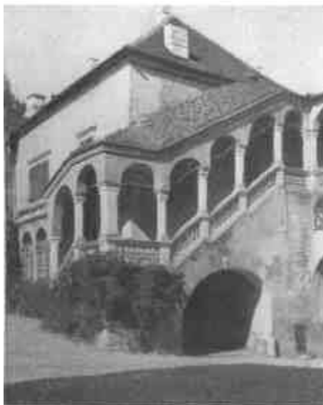
Részlet a sárospataki vár udvarából