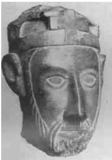
Királyszobor töredéke Kalocsáról, XII–XIII. sz. (M. Nemz. Múzeum)