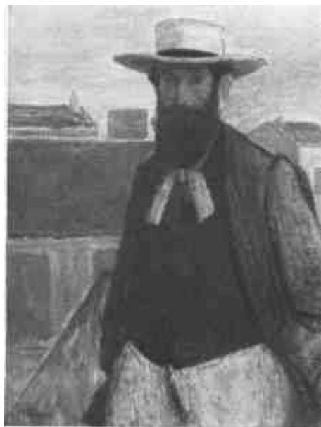
Rippl-Rónai József: Aristide Maillol (Letét az Új Magyar Képtárban)