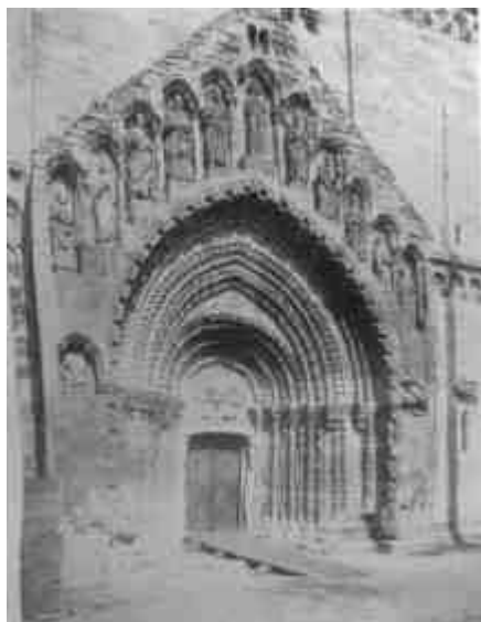
A jáki templom főkapuja