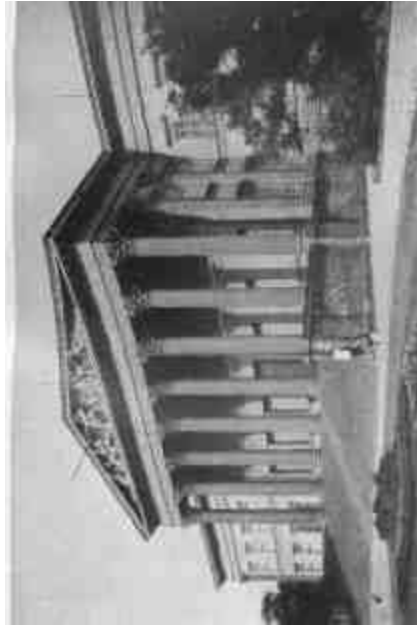
Podlak. Műhely. A Magyar Nemzeti Múzeum Budapesten