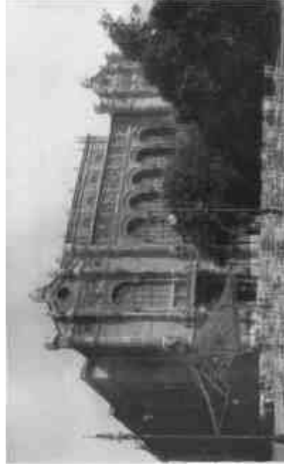
Fest Frigyes. A budapesti Vigadó