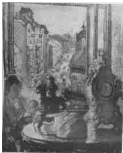
Csók István: Népszínház-utca (Magántulajdon)