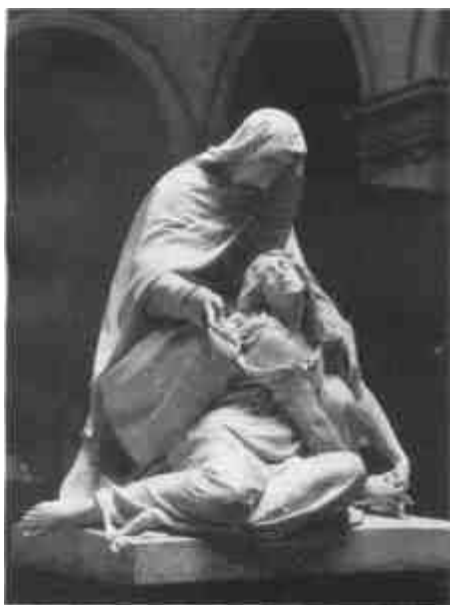
Zala György: Mária és Magdolna (Szépművészeti Múzeum)