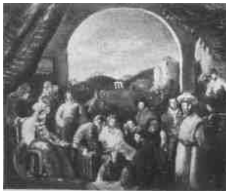
Rudnay Gyula: Tanácskozás (Magántulajdon)