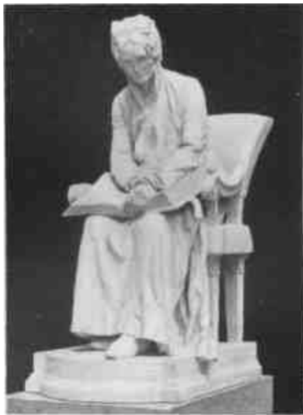
Stróbl Alajos: Anyánk (Szépművészeti Múzeum)