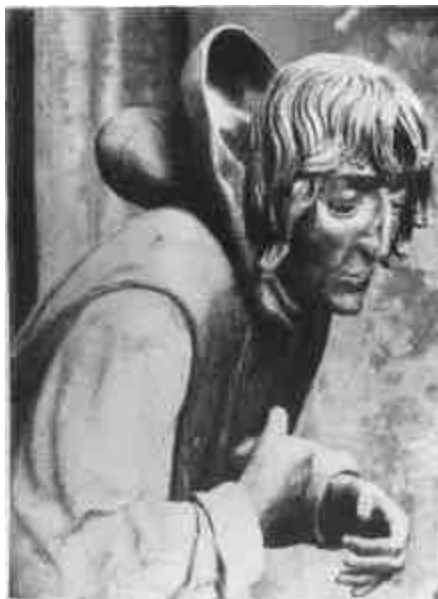
Lőcsei Pál: Bethlehemi pásztor a lőcsei plébániatemplomban