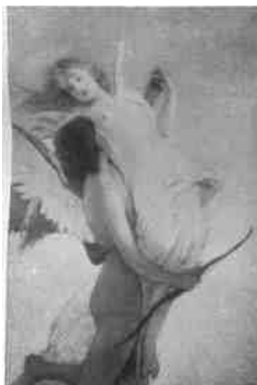
Lotz Károly: Ámor és Psyche (Magántulajdon)