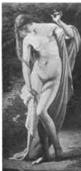
Székely Bertalan: Forrás (Magántulajdon)