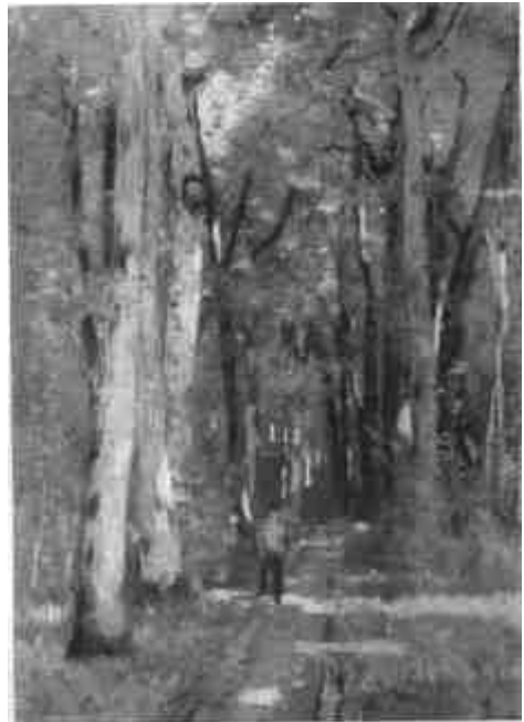
Paál László: Fontainebleau-i erdő (Szépművészeti Múzeum)