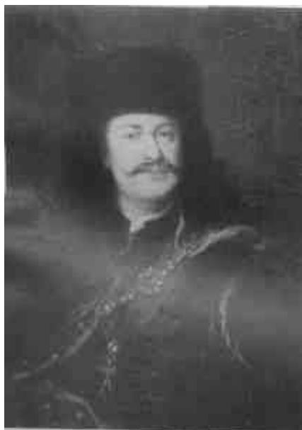
Mányoki Ádám: II. Rákóczi Ferenc (Szépművészeti Múzeum)