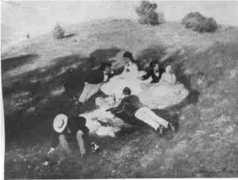
Szinyei Merse Pál: Majális (Szépművészeti Múzeum)