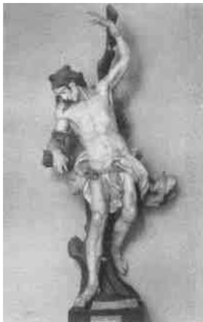
XVIII. sz. mester: Szt. Sebestyén (Szépművészeti Múzeum)