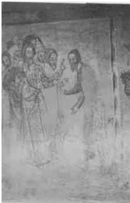
XIV. századbeli falikép az almakeréki templomban