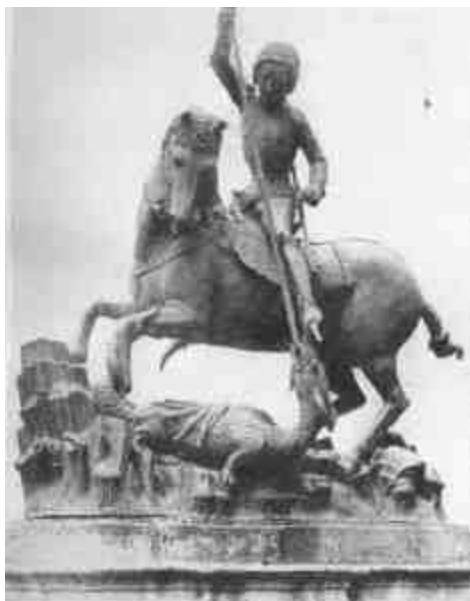
Kolozsvári Márton és György: Szt. György lovasszobra a prágai Hradsin udvarán