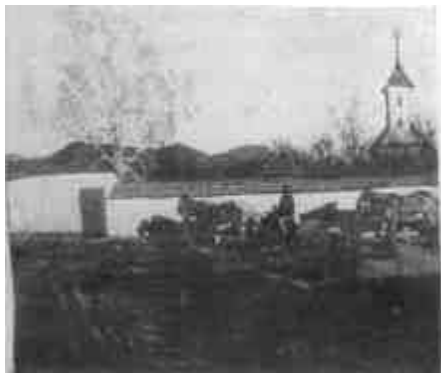
Ferenczy Károly: Márciusi est (Új Magyar Képtár)