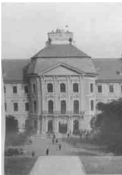
Fellner Jakab: Az egri lyceum