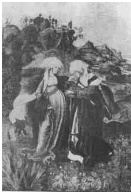
M. S. mester: Mária látogatása (Szépművészeti Múzeum)