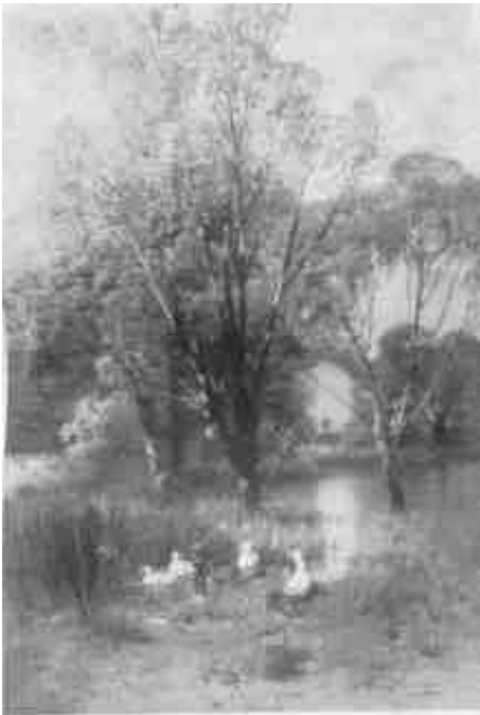
Mészöly Géza: Patak partján (Magántulajdon)