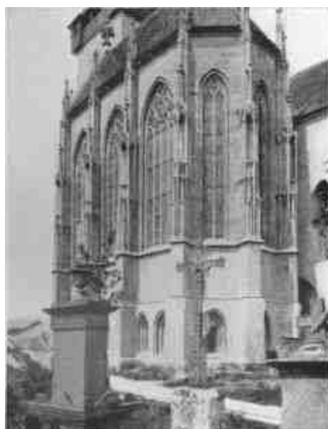
A csütörtökhelyi kettős kápolna