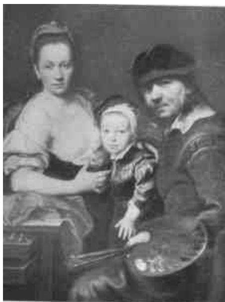
Kupetzky János: A mester családjával