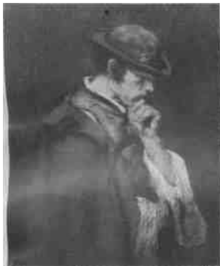
Munkácsy Mihály: Parasztlány (Szépművészeti Múzeum)