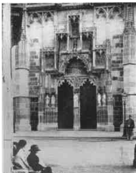
A kassai székesegyház déli kapuja