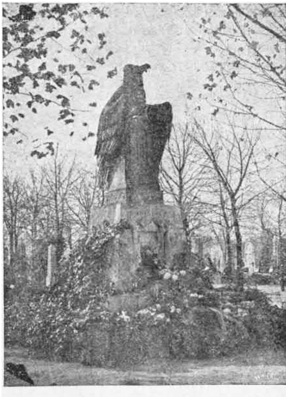
Petőfi szüleinek síremléke.