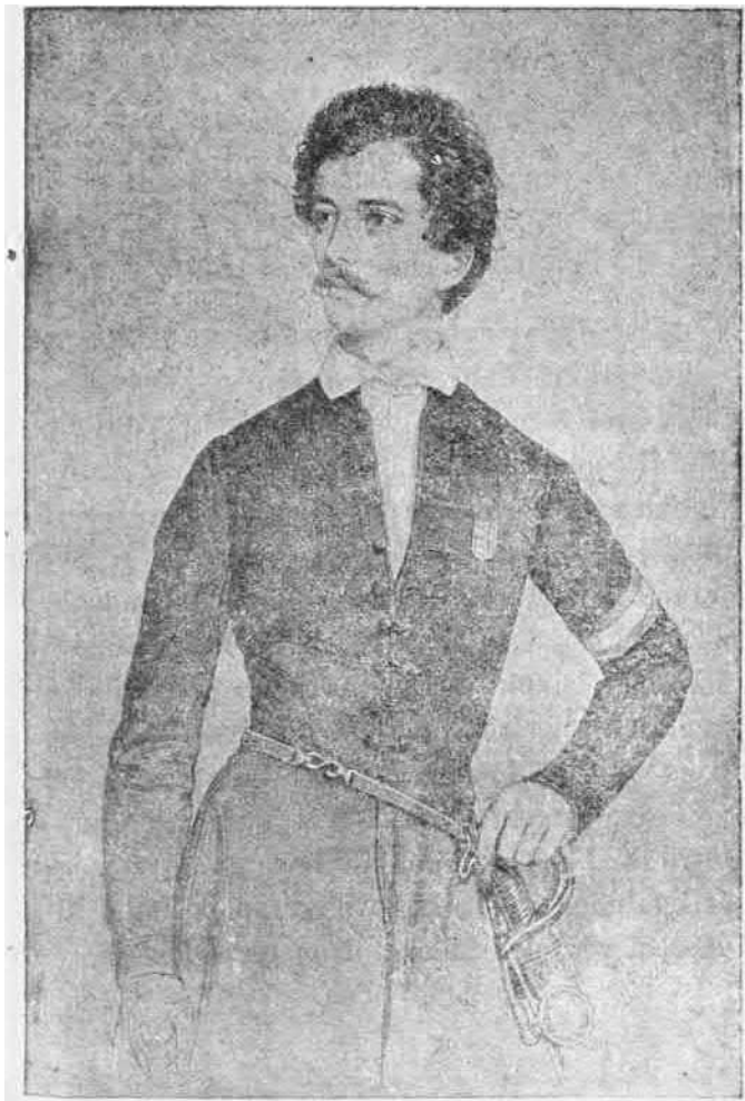
Petőfi a szabadságharcban.