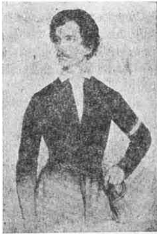
Petőfi a szabadságharcban.

Kossuth Lajos csodát mívelt. Lángszavára