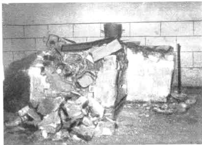
Pécs, Elpusztított főzöldy maradványai egy középületben a szerb rombolás után.