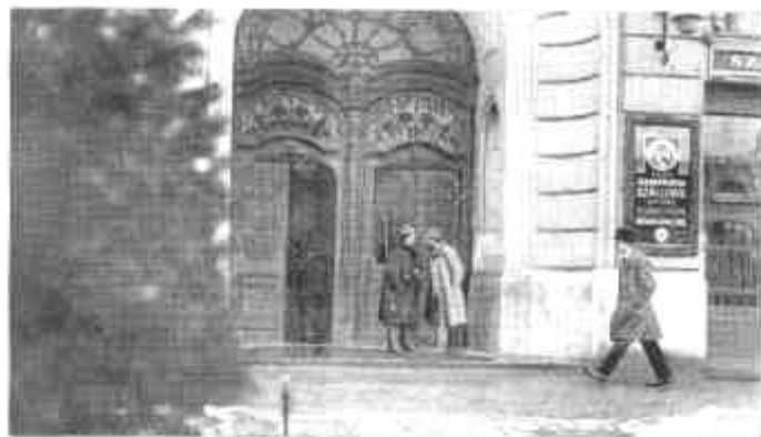
Szorb őrség a pilseni városi ház kapujában.