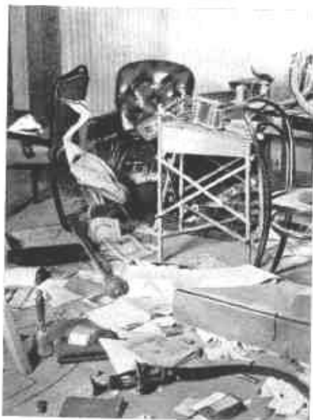
Fogyvernek. Egy szoba a román pusztítás után.