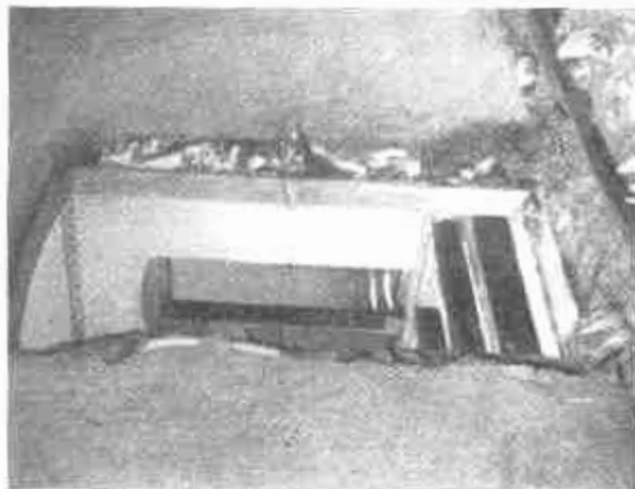
Pecs. Így garázdálkodtak a szerbek a megszállítás alatt a közepüferőben.