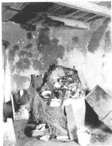
Pécs, Szerb pusztítás a megsemmítés végén.