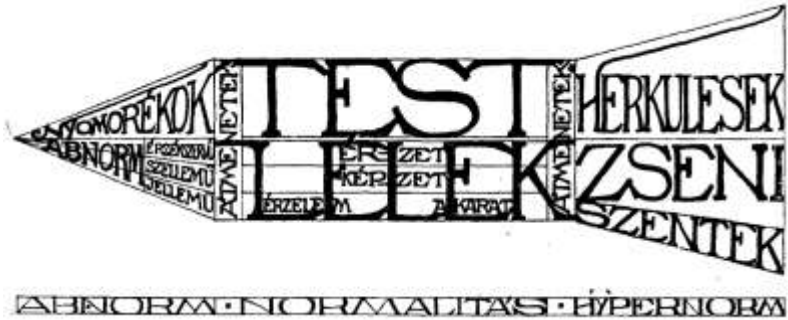
1. ábra. Az abnormalitás, a normalitás és hypernormalitás grafikus ábrázolása.

Normálisnak nevezzük mindazt, ami. a megszokott köznapi fogalmakat, a gyakori átlag értékeket, az egyetemes emberi célokat (önfenntartás, a társadalomba való beleilleszkedés) fedi. A normalitás tehát nem pont, hanem út, távolság; távolság a változatok számtalan