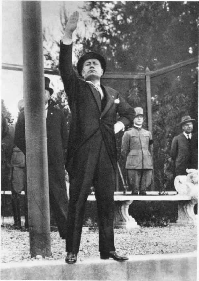
MUSSOLINI ÜDVÖZLI AZ AVANTGARDISTÁKAT