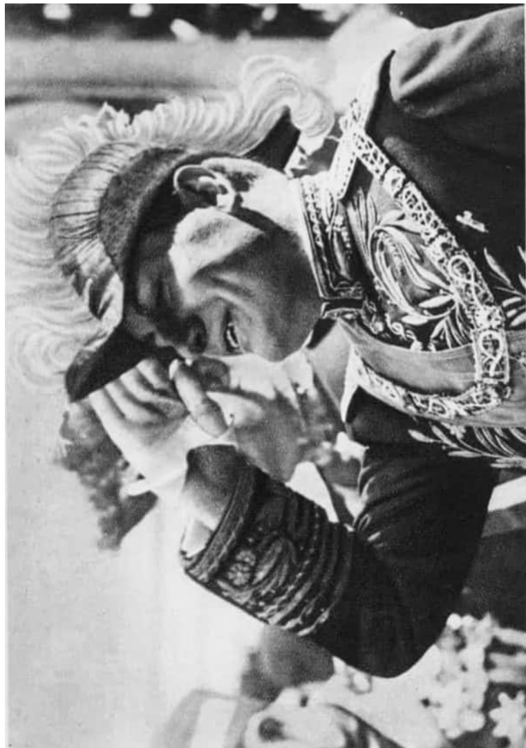
MUSSOLINI ÜDVÖZLI A TISZTELETÉRE KIVONULT CSAPATOKAT