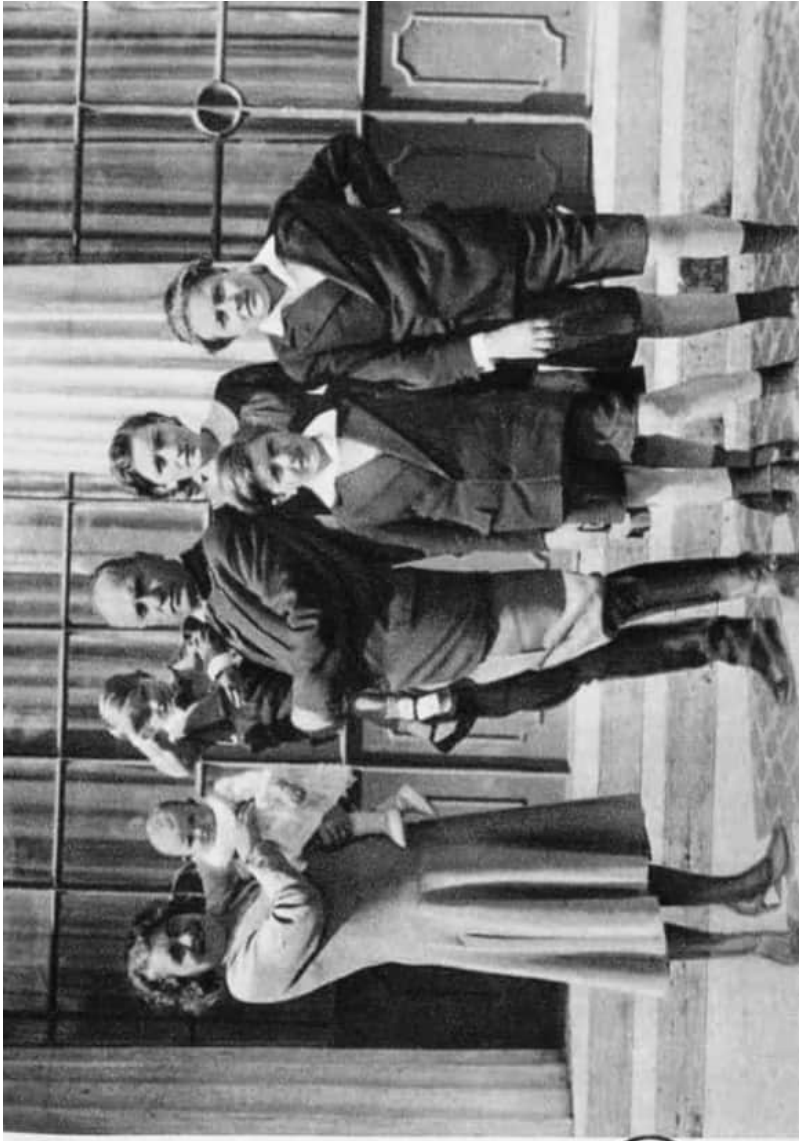
MUSSOLINI CSALÁDJA KÖRÉBEN