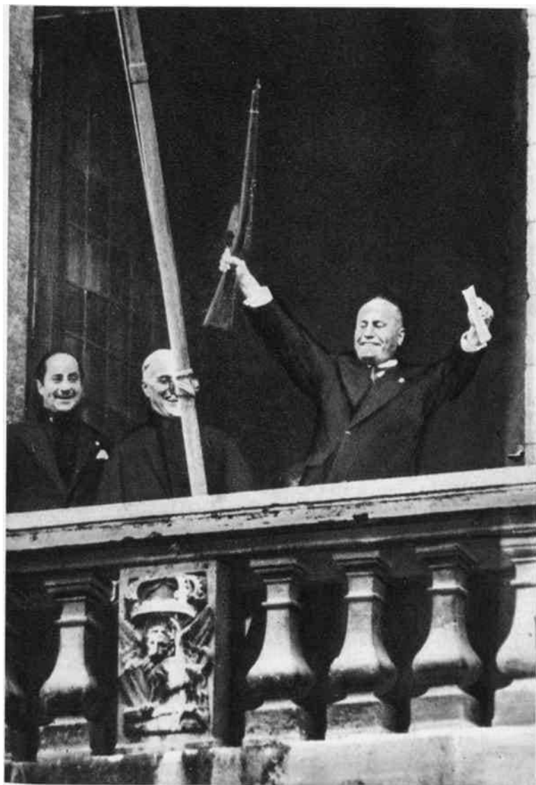
KÖNYVET ÉS FEGYVERT MUTAT MUSSOLINI A BALILLÁKNAK: KÖNYV ÉS FEGYVER LEGYEN AZ EREJÜK