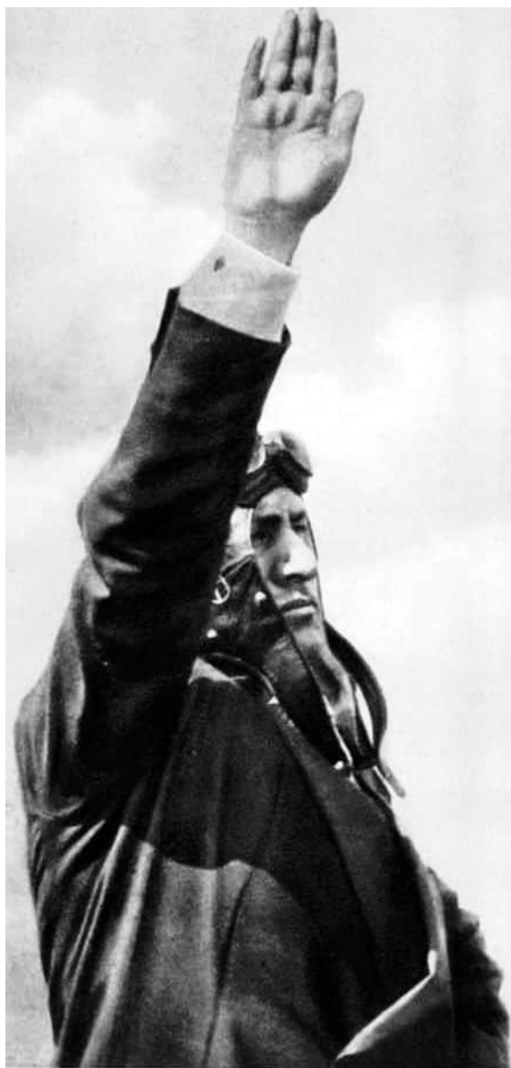
A FASISZTA ÜDVÖZLET