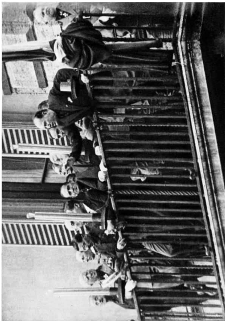
A MARCIA SU ROMA NEGYEDIK ÉVFORDULÓJÁN MUSSOLINI A CHIGI-PALOTA ERKÉLYÉRŐL BESZÉL